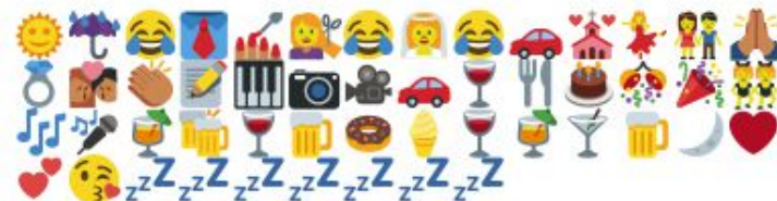
Der Tennisspieler Andy Murray beschrieb den Ablauf seiner Hochzeit für seine Fans ausschließlich mithilfe von Emojis

toll finden, schicken Sie ihr doch nicht Zwinkergesichter. Sondern formulieren Ihre Sätze treffend.